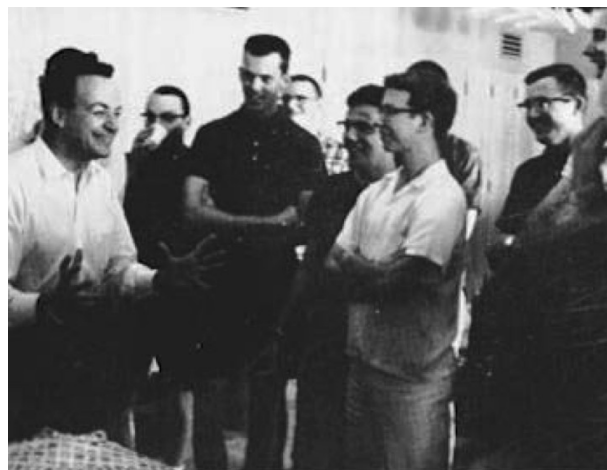
FEYNMAN (à gauche) entouré de ses étudiants.

Q 12 Le principe de la propulsion par réaction