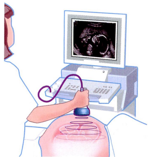
FIG. 3 – Principe de l'échographie.

En échographie, on utilise des ondes ultrasonores de fréquences comprises entre 2 MHz et 20 MHz (avec 1 M= 10^6 pour la définition de « méga »).